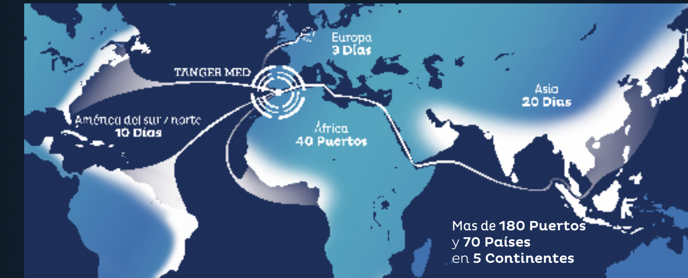
DISTRIBUCIÓN DEL TRÁFICO DE CONTENEDORES EN UNIDADES POR ZONAS GEOGRÁFICAS